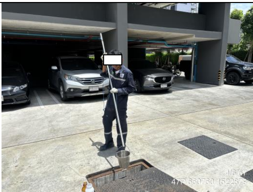
บริเวณก่อนเข้าสู่ระบบบำบัดน้ำเสีย บ่อเกรอะ ชุดที่ 2