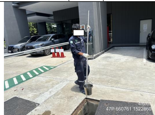
บริเวณหลังออกจากระบบบำบัดน้ำเสีย- บ่อตรวจคุณภาพน้ำ ชุดที่ 2