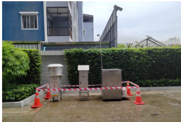
ภายในพื้นที่โครงการ