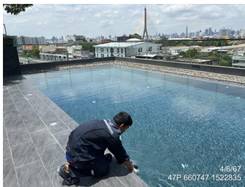
สระว่ายน้ำบริเวณส่วนลึก