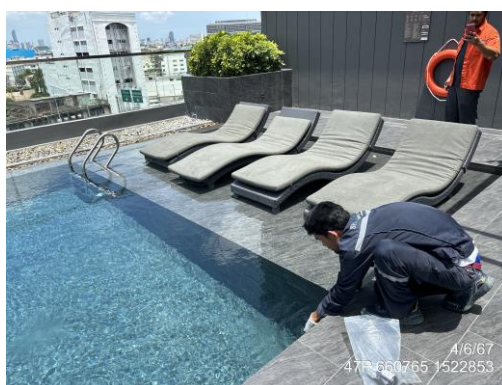
สระว่ายน้ำบริเวณส่วนตื้น

รูปที่ 3-2 จุดตรวจวัดคุณภาพน้ำจากสระว่ายน้ำ (Swimming pool water) ของโครงการ ชีวาทัย ปิ่นเกล้า (Chewathai Pinklao) นิติบุคคลอาคารชุด ชีวาทัย ปิ่นเกล้า